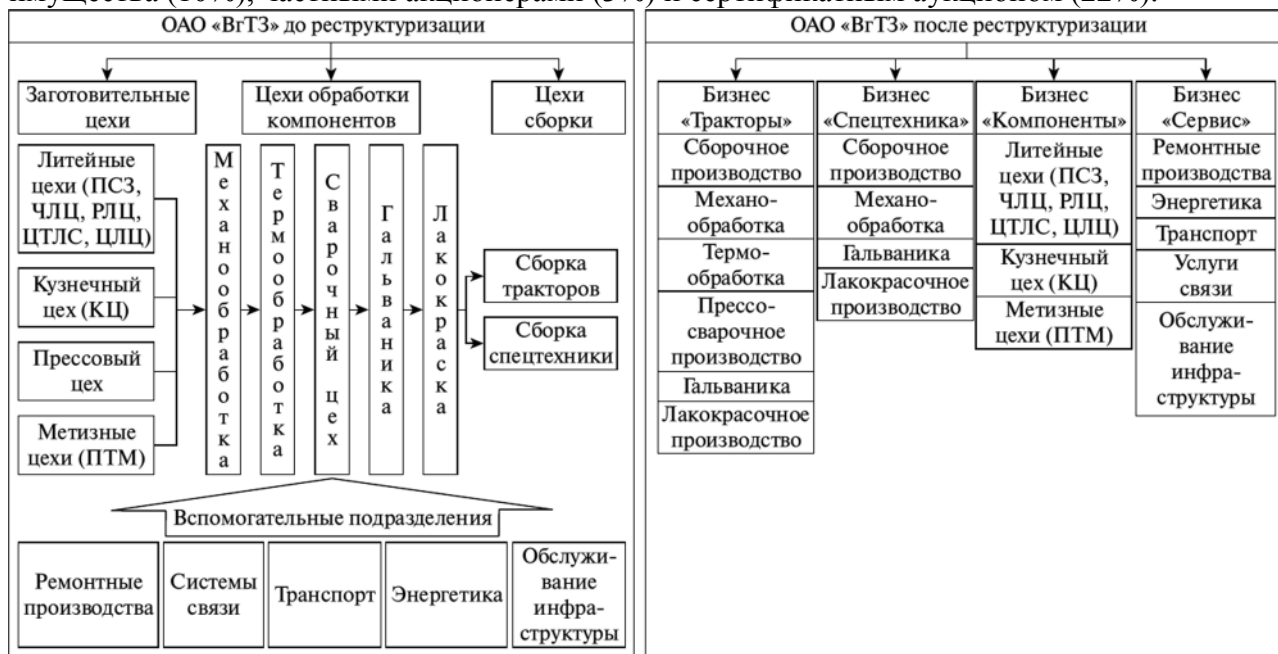
Рис. Структура ОАО «Волгоградский тракторный завод» до и после реструктуризации

Завод сантехнического оборудования был образован как часть строительного объединения в секторе жилищного строительства и отвечал за монтажные услуги. В 1994 году завод был преобразован в открытое акционерное общество на основе отделения от исходного предприятия. Акционерный капитал был распределен между работниками (40%), трастовыми компаниями и инвестиционными фондами (25%), фондом государственного имущества (10%), частными акционерами (3%) и сертификатным аукционом (22%).