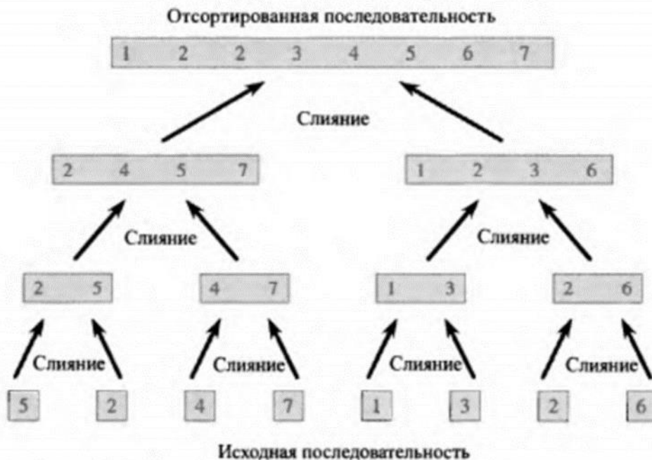
Рис. 2.4. Процесс сортировки слиянием массива A = \langle 5, 2, 4, 7, 1, 3, 2, 6 \rangle . Длины подлежащих слиянию отсортированных последовательностей возрастают в ходе работы алгоритма.

1) Используя в качестве образца рис 2.4, проиллюстрируйте работу алгоритма сортировки слиянием для массива A = \langle 3, 4, 1, 5, 2, 6, 3, 8, 5, 7, 9, 4, 9 \rangle .