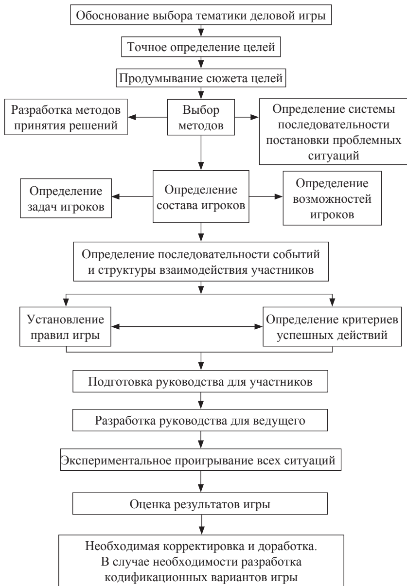
Рис. 1.1. Принципы разработки деловых игр